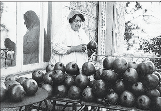
تصویری از عصمت الدوله، دختر ناصرالدین شاه