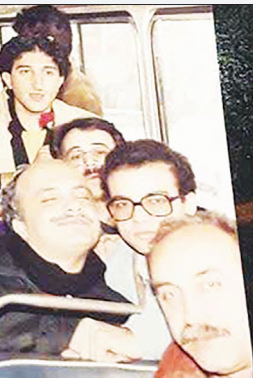
بازیگران ساعت خوش در حال رفتن به بی...

کافی است کمی هوا به رو به گرمی رود آن وقت است که مردم برنامه‌ای جز سفر به شهرهای شمالی ندارند. سفری که اولین دستاوردش برای مناطق زیبای جنگلی و سواحل دریای شمال چیزی نیست جز تولید انبوه زباله. به گفته معاون امور جنگل‌های سازمان جنگل‌ها، مراتع و آبخیزداری کشور روزانه ۶ هزار و ۲۵۰ تن زباله و پسماند در عرصه‌های منابع طبیعی و مرعی شمال کشور دفن می‌شود. زباله‌هایی که این روزها به عنوان بزرگترین دغدغه‌های زیست محیطی و عامل تهدید زندگی جنگل‌ها مطرح می‌شود. طلای سیاهی که این روزها در گوشه و کنار شهرهای شمالی مولود کوه‌های بزرگ و کوچکی هستند که هر چه برای