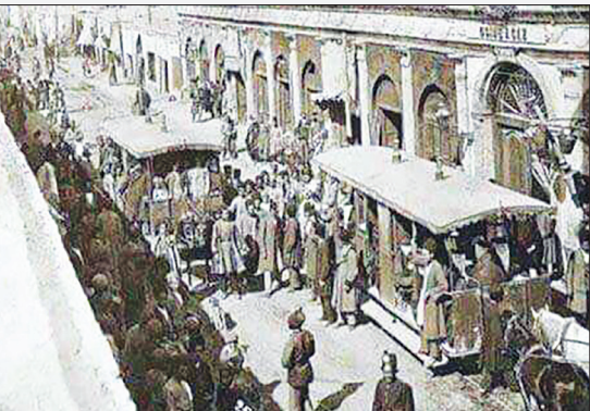
تصویری از واکن اسبی - طهران - سال ۱۳۰۲