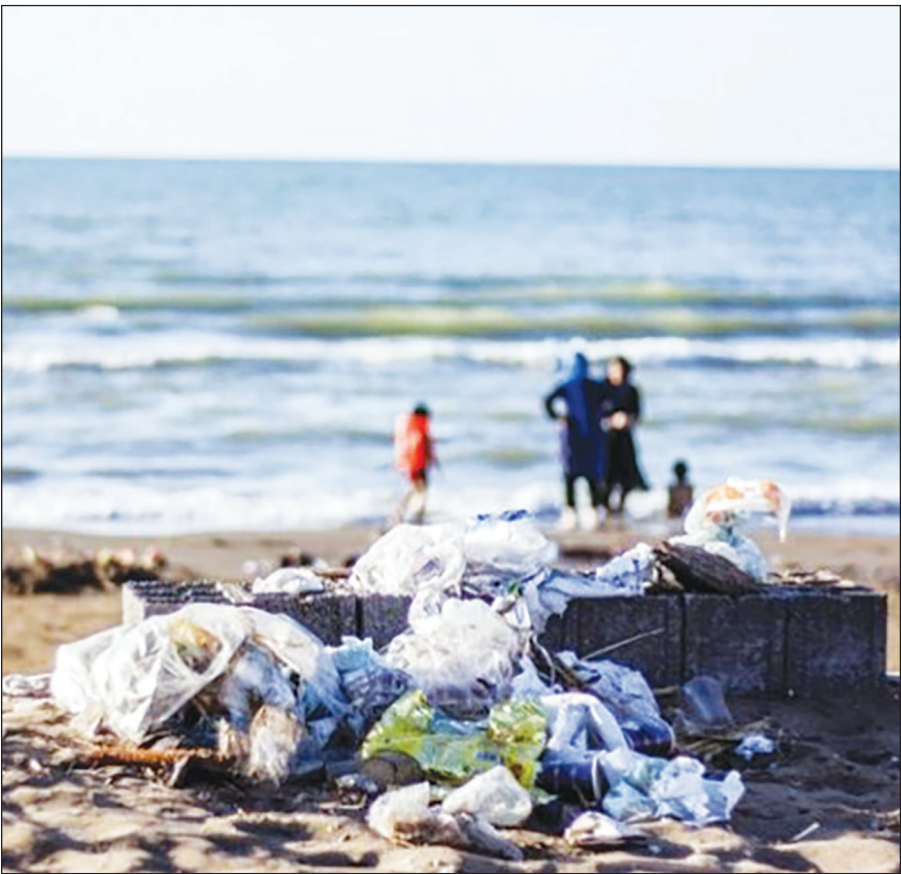
سواحل مازندران و مشکلی همیشگی به نام زباله

داستان دفن زباله‌ها و کسانی که بین تپه‌های زباله زندگی می‌کنند از پرمجاثرترین داستان‌هایی است که تا حالا شنیده‌اید