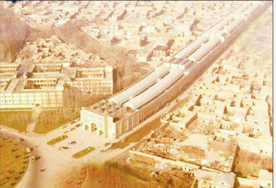
عکس هوایی از بازار رضای مشهد در دهه ۵۰