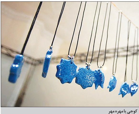
کوجی یا مهره مهر

استان قم تولید کننده «کوجی» و یا همان «مهره مهر» است، هنری که قدمت ۶ هزار ساله دارد