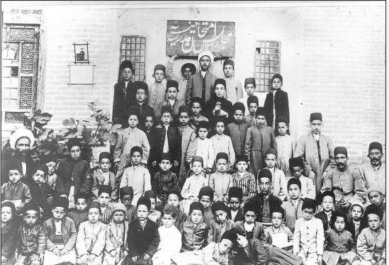
مدرسه ای در ارومیه ۱۳۲۸ ه.ق