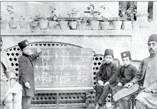
کلاس ریاضی دوره قاجار