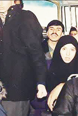
سر صحنه: ۱۳۷۲