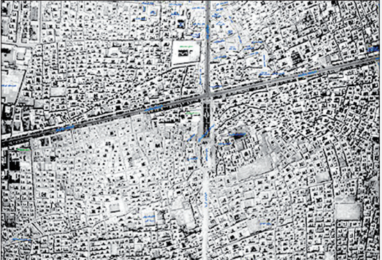
بافت تاریخی یزد (عکس هوایی) - سال ۱۳۳۵