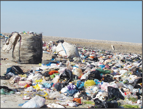
دفن زباله در خرمشهر