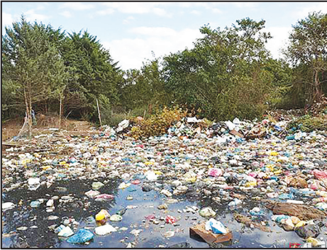
دفن زباله در جنگلهای شمال

از جنگلهای سرسبز شمال که بیرون بیاییم و دل به مناطق کویری بزنیم، باز چشم زباله ها همان است که بود. مناطق خشک و کویری که این روزها دل خوشی از زباله ها و شیرابه هایش ندارد و دفن اصولی زباله ها هم سلامت مردمانشان را تهدید می کند. هم ذخایر محدود منابع آب را، منطقه اوزید آباد از توابع شهرستان آران و بیدگل در استان اصفهان یکی از مناطقی است که سالهاست مردمش از همسایگی با محل دفن زباله ها گلایه مندند. منطقه ای