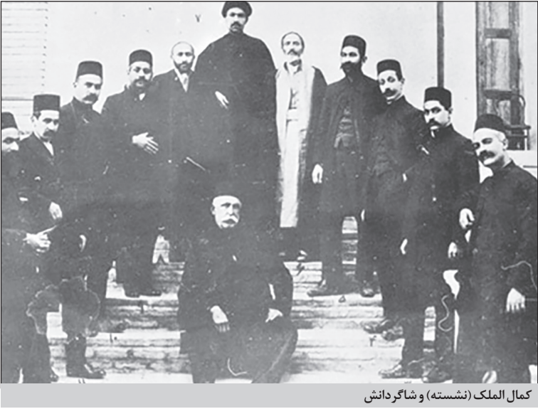
کمال الملک (نشسته) و شاگردش

به بهانه ۱۴ مرداد، روز مشروطه، نگاهی به زندگی کمال الملک و نقشی که در جریان مشروطه داشت، انداخته‌ایم